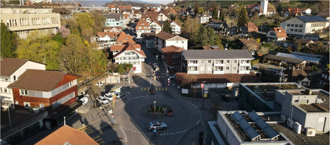
Ab Mitte April schmücken imposante Trauffer-Holzkühe den Kronenplatz

Im April wird der Kronenplatz mit drei imposanten Holzkühen der Trauffer Holzspielwaren AG dekoriert. Über das Instagram-Konto «my_spiez» erhalten Sie exklusive Einblicke und Hintergründe zur Aktion.